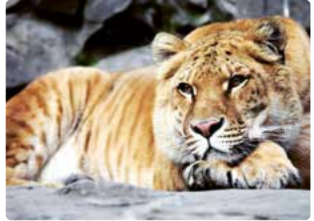
Vater Löwe, Mutter Tiger – so entsteht ein Liger.

Eine Hybridisierung, also eine Kreuzung zweier Arten, ohne dass diese in der nächsten Generation selbst Nachwuchs bekommen können, ist etwa auch bei Löwen ( Panthera leo ) und Tigern ( Panthera tigris ) oder Finn- ( Balaenoptera physalus ) und Blauwalen ( Balaenoptera musculus ) möglich. Während die Mischung aus Löwen und Tigern nur in Gefangenschaft stattfindet (sog. Liger oder Töwen), weil sich beide in freier Wildbahn eigentlich nicht begegnen, kommt es bei Finn- und Blauwalen durchaus auch in freier Natur gelegentlich zu Kreuzungen. Im Sommer 2018 wurde ein solches Exemplar von isländischen Walfängern gefangen.